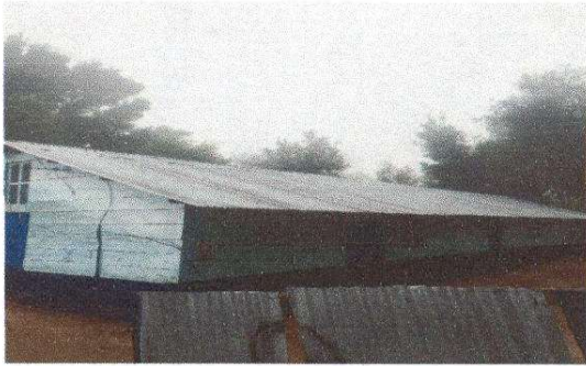
Foto 1: Sustitución de lámina, por lámina troquelada aluzinc calibre 26