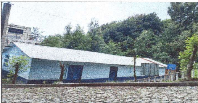
Foto 5: Sustitución de lámina, por lámina troquelada aluzinc calibre 26