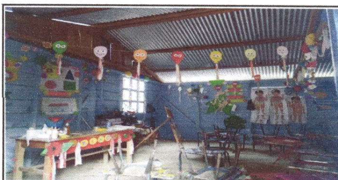
Foto 6: Sustitución de estructura de soporte de madera, por metal

Observación: Si es necesario se pueden agregar hojas adicionales y actualizar el número de hojas.