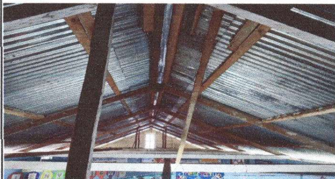
Foto 3: Sustitución de estructura de soporte de madera, por metal